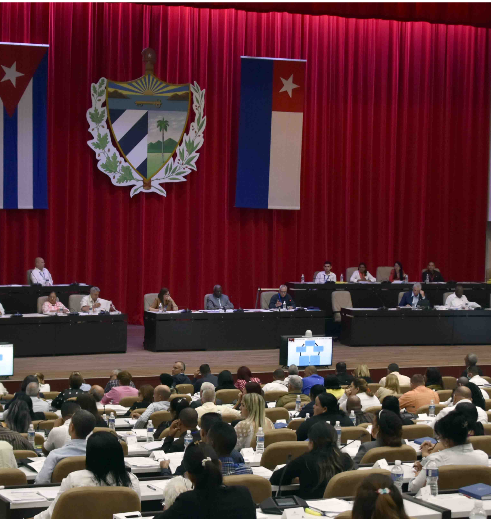
Evalúan diputados a la Asamblea Nacional del Poder Popular implementación de la ley de Soberanía Alimentaria y Seguridad Alimentaria y Nutricional. Asistieron el General de Ejército Raúl Castro Ruz, líder de la