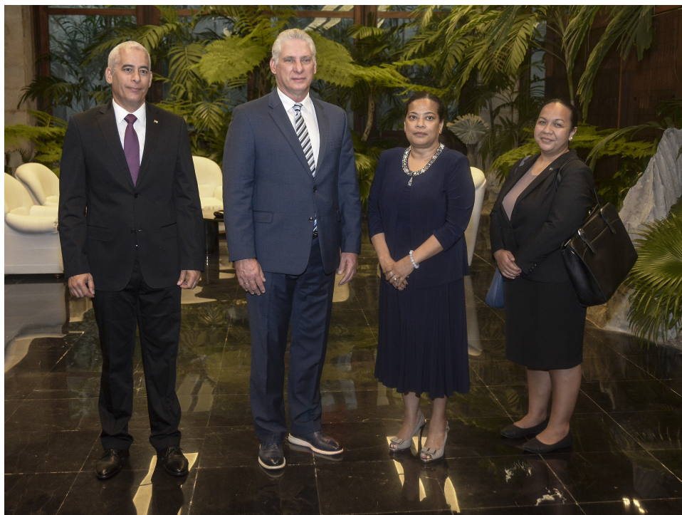
Embajadora de la República de Nauru, la excelentísima señora Margo Deiye.

Especial gratitud manifestó por su parte la excelentísima señora al referirse a la formación de profesionales de la Salud. «¡Muchas gracias!», acentuó.