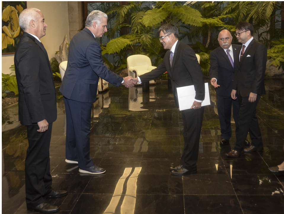
Embajador de la República Democrática Popular Lao, el excelentísimo señor Vanhtha Sengmeuang.