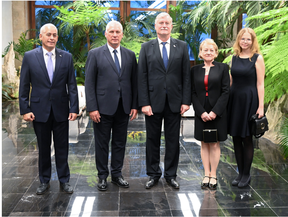
Excelentísimo Señor, Zdenek Kubánek, de la República Checa.

Luego, en representación de la República de Bosnia y Herzegovina, llegó al Salón protocolar el Excelentísimo Señor, Aleksandar Bogdanic, a quien el Presidente Díaz-Canel, luego de ofrecerle una cordial bienvenida, dijo recordar con mucha satisfacción la visita que en 2023 hiciera a la Isla la Presidenta de esa nación, Zeljka Cvijanovic. Fue ese, valoró, un momento para reimpulsar las relaciones bilaterales y llevarlas a un plano superior.