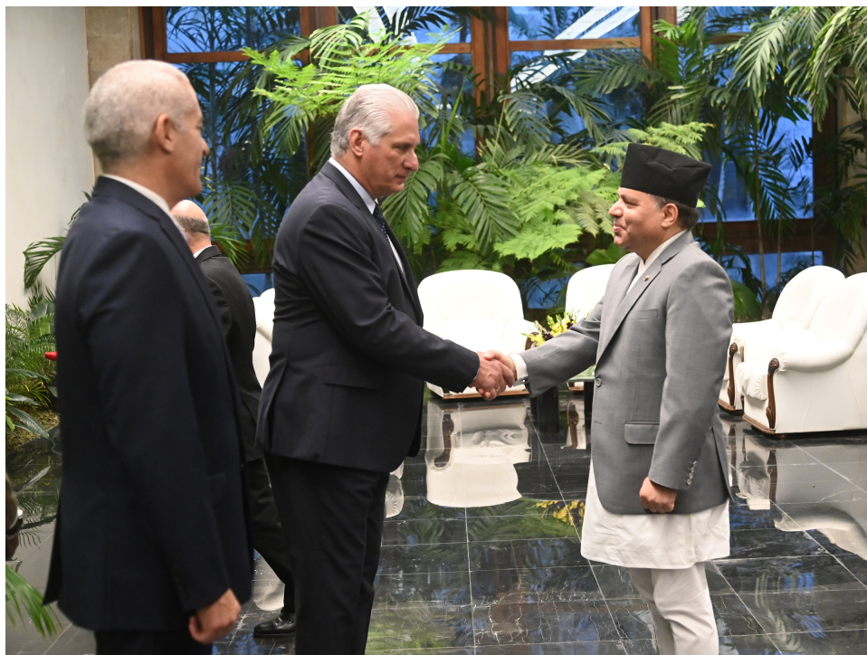
En representación de Nepal, el Excelentísimo Señor, Bharat Raj Paudyal.

Desde el establecimiento de las relaciones diplomáticas, expresó el embajador, esos nexos han sido "muy cordiales y muy amigables". Y recalcó: "Nepal se siente honrado de estar al lado de Cuba en múltiples foros internacionales". Igualmente hizo explícita la gratitud por el apoyo del pueblo cubano en momentos difíciles, como en aquellos días del terremoto del 2015, cuando una brigada de médicos de la Isla dio "lo mejor de sí".