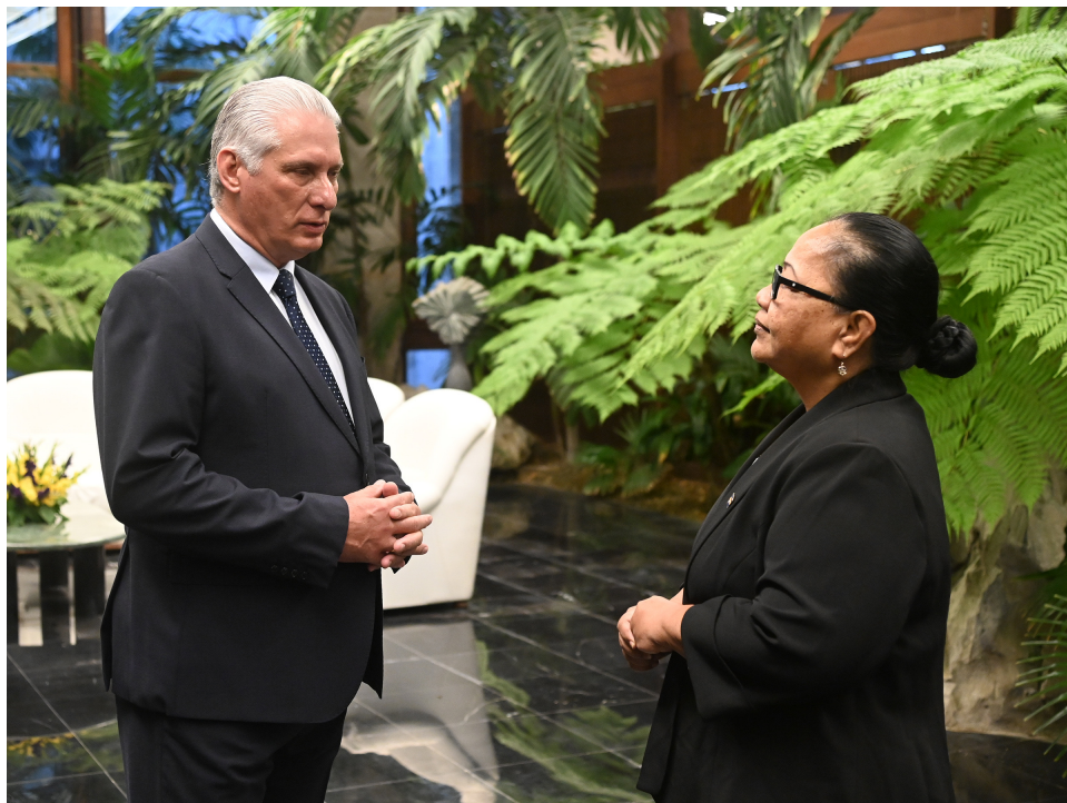
La Excelentísima Señora, Lara Erab Daniel, de la República de Nauru.

La representante del país en Oceanía afirmó que seguirán apoyando a Cuba en el espacio de las Naciones Unidas, y compartió su certeza de que el país caribeño continuará apoyando a la República de Nauru en su enfrentamiento a desafíos múltiples, especialmente los concernientes a la Salud, y a los nocivos efectos que, con fuerza para esa región, se vienen derivando del cambio climático.