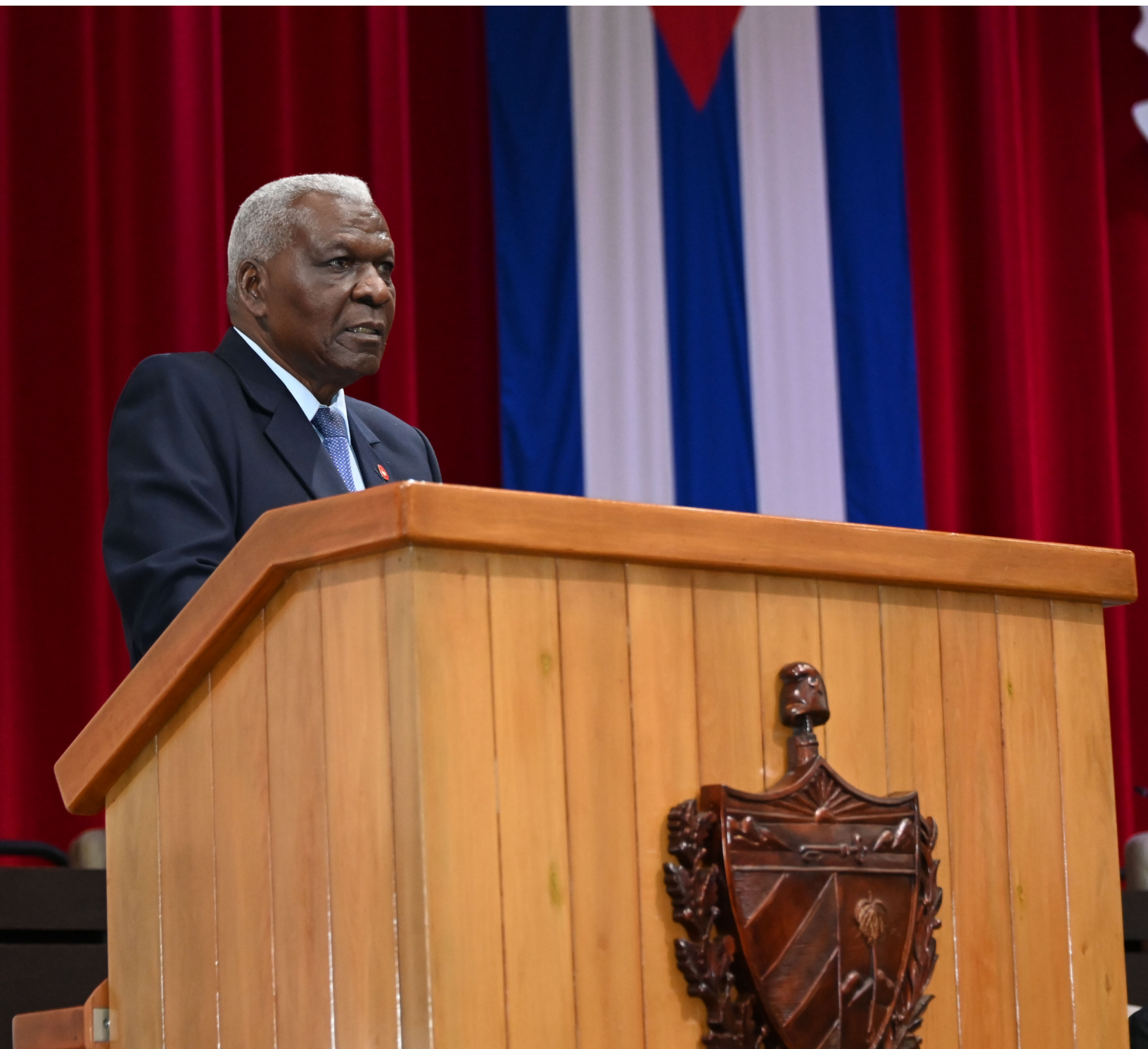
Por Vietnam, hasta nuestra propia sangre, dijo Fidel en un momento de la historia.

En otro momento, y una vez frente al podio del amplio recinto, Esteban Lazo enunció que el significado de la victoria de Playa Girón trasciende en la historia, demostró lo que el pueblo caribeño fue capaz de hacer por defender su soberanía.