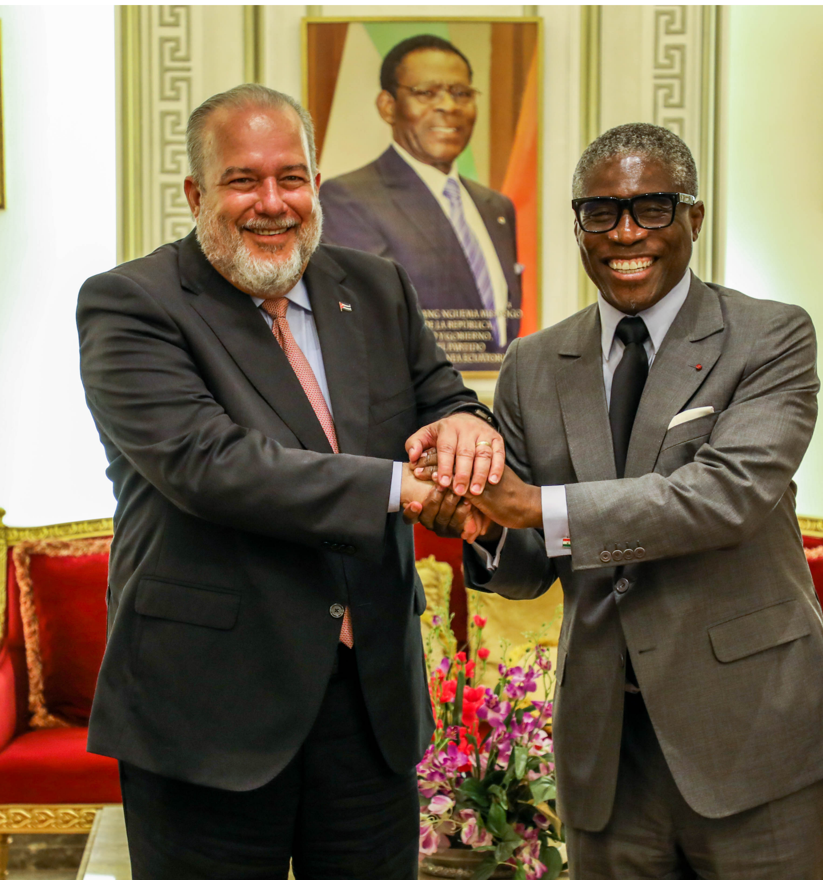
Como parte de su visita oficial a la República de Guinea Ecuatorial, el miembro del Buró Político y primer ministro, Manuel Marrero Cruz, sostuvo encuentros con Teodoro Obiang Nguema Mbasogo y Teodoro Nguema