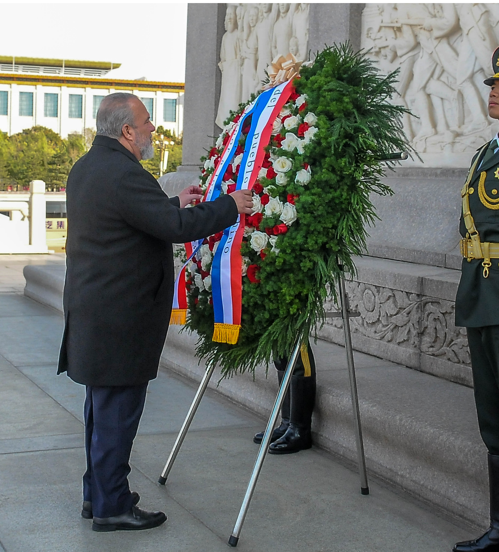
Luego de fructíferas jornadas de trabajo en Shanghái, el primer ministro, Manuel Marrero Cruz, y la delegación que lo acompaña, continuaron este