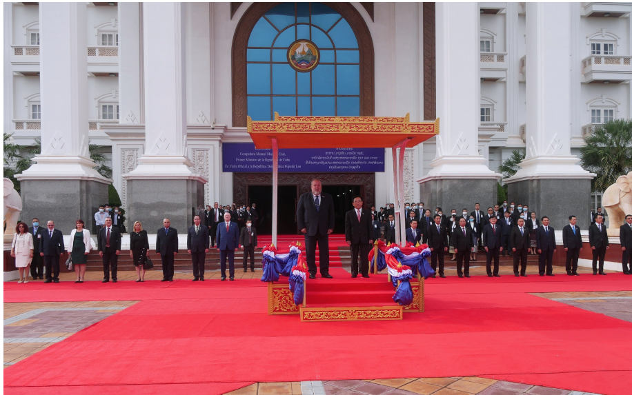
Ceremonia oficial de recibimiento, en compañía de su homólogo, Phankam Viphavanh

Durante el diálogo de alto nivel, Phankam Viphavanj dijo sentirse honrado de poder trabajar con la delegación cubana, y aseguró que la visita tendrá un significado importante para fortalecer los nexos de amistad y comerciales.