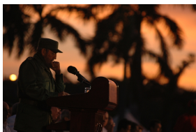
Acto popular en la Plaza de la Revolución para celebrar la entrada de Bolivia al ALBA, 29 de abril del 2006.

Hace casi veinte años, Fidel y Chávez dieron el histórico paso de fundar una alternativa bolivariana y humanista que se convirtió en alianza de paz, cooperación y solidaridad, por el bien común y la unión de Nuestra América. Dos gigantes trazaron un rumbo de lucha y resistencia. Corresponde a los líderes de hoy, junto a sus pueblos, seguir enarbolando la bandera del optimismo y la esperanza, de la solidaridad y la integración plena.